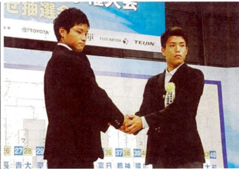
握手をして健闘を誓い合う都市大塩尻の青島主将(左)と神戸弘陵学園の中浜主将