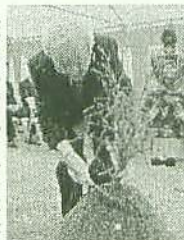
鎌を入れる下永田社長